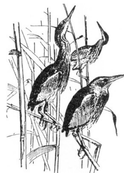
Natur- und Vogelschutzverein Lauchetal

Anmeldungen zur Mithilfe und zum Bräteln bis zum 27. Mai 2024 an Sonja Pais unter spais@gmx.net oder Whatsapp 078 307 26 62