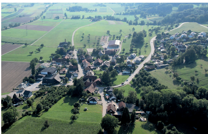
Domenic Wyss fotografierte mit der Drohne die vier Dörfer unserer Gemeinde (v.o.l.n.u.r. Affeltrangen, Märwil, Zezikon, Buch b. Märwil).